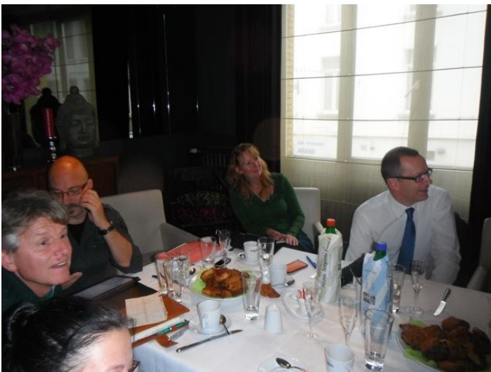
Eerst geboeid luisteren naar tips over externe communicatie op scholen...