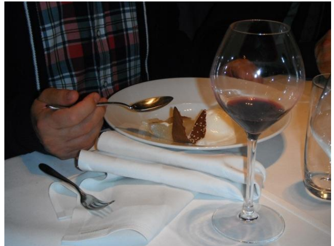
i ...en erna culinaire verwennerij van hoog niveau en genieten van spijs en drank